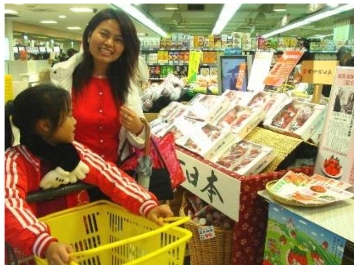
アジアで販売される日本産農産物